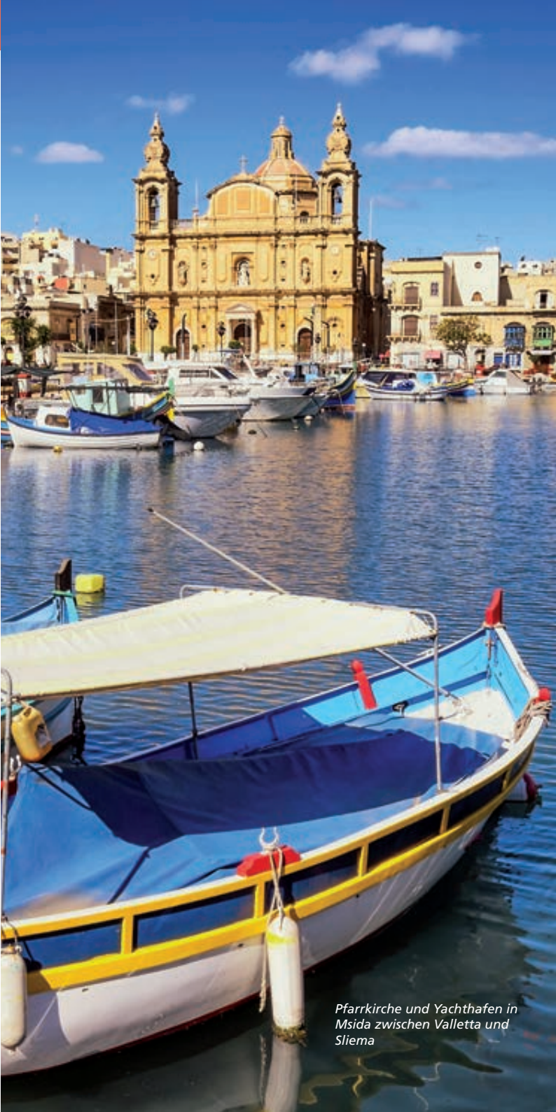
Pfarrkirche und Yachthafen in Msida zwischen Valletta und Sliema