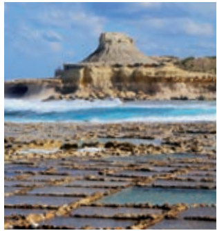
Salzpfannen an der Xwieni Bay, im Hintergrund der »Elephant Rock«

Ideal für ein romantisches Abendessen mit Meerblick und Meeresrauschen. Frische maltesisch-mediterrane Küche. €€–€€€