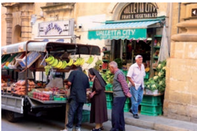
Geschäfte nehmen oft auch die Straße in Beschlag (Triq il-Merkanti)