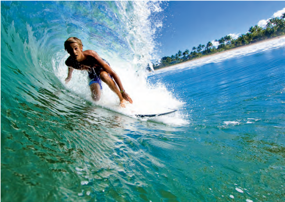
Paradies der Wassersportler: Wellenreiter vor Maui

Zwar ist es vielleicht die schönste Reiseart, ins Blaue zu fahren und sich einfach treiben zu lassen – aber im Ernst ist dies nur machbar, wenn die Urlaubszeit ebenso unbegrenzt ist wie die Reisekasse. Einerseits will man baden und braun werden, schnorcheln und golfen, andererseits aber auch keine Höhepunkte des Landes verpassen. Einerseits möchte man stundenlang auf einer Klippe über dem Meer sitzen und der tosenden Brandung zusehen, andererseits will man die Inseln möglichst vollständig bereisen, Vulkane gucken, vielleicht im Dschungel wandern, einsame Wasserfälle entdecken und auch mal abseits der Touristenpfade verträumte Ecken des alten Hawai'i erkunden. Und am Ende sollte man auch noch erholt aus dem Urlaub heimkehren. Man wird also vorplanen, sich Ziele und Grenzen stecken müssen, damit die Inseltour auch